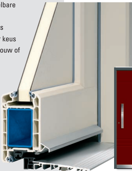
Thermisch gescheiden drempels van aluminium voor kunststof huisdeuren (standaarduitvoering)